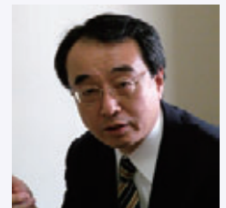
NTTデータ ジェトロックス株式会社 ビジネスパートナー 株式会社オリテック九州 システム営業部 部長