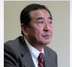
熊本中央信用金庫 事務集中部 常勤理事

タへのアクセスログを LogStare で監視しているのだ。同金庫に導入された LogStare は、ネットワーク内のファイルサーバと MetaFrame の間に設置され、その間を流れるデータを読み取って記録する。