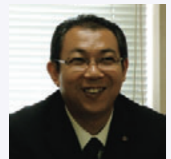
熊本中央信用金庫 事務集中部 事務集中課 代理