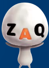
ZAQのキャラクター「ぎっくう」

LogStare CASE STUDY VOL.06 Technology Networks